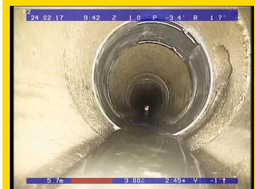
Schaden nach der Reparatur mit der VA Manschette