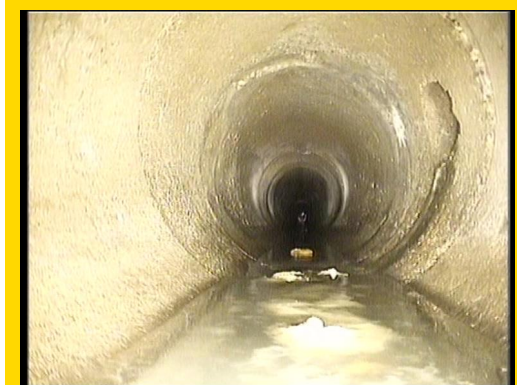
Schaden vor der Reparatur mittels Quick-Lock VA Manschette.